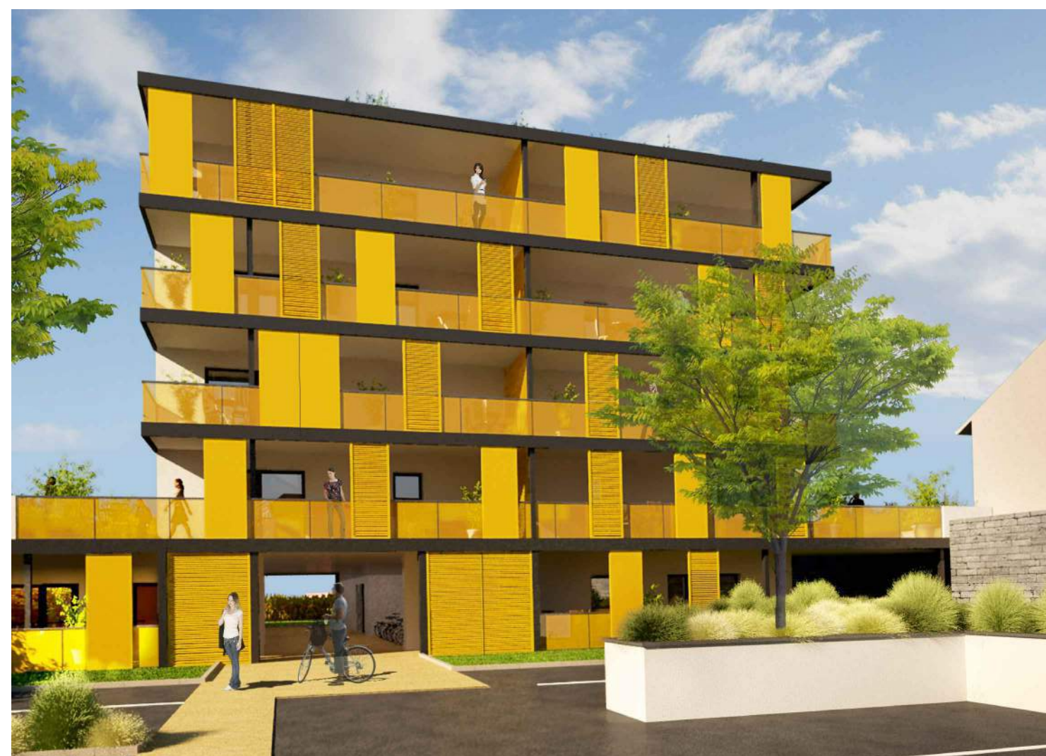
Adresse postale au Siège Social "SNC L'HORLOGERIE" - 380 Grande rue - BP29 - 01 570 FEILLENS - Tel: 03 85 36 13 13

IMPACT IMMOBILIER Conception et Réalisation IMPACT IMMOBILIER 380 Grande rue - BP29 01 570 FEILLENS Tel: 03 85 36 13 13 Site: www.impact-foncier.com Email: impact.immobilier@orange.fr