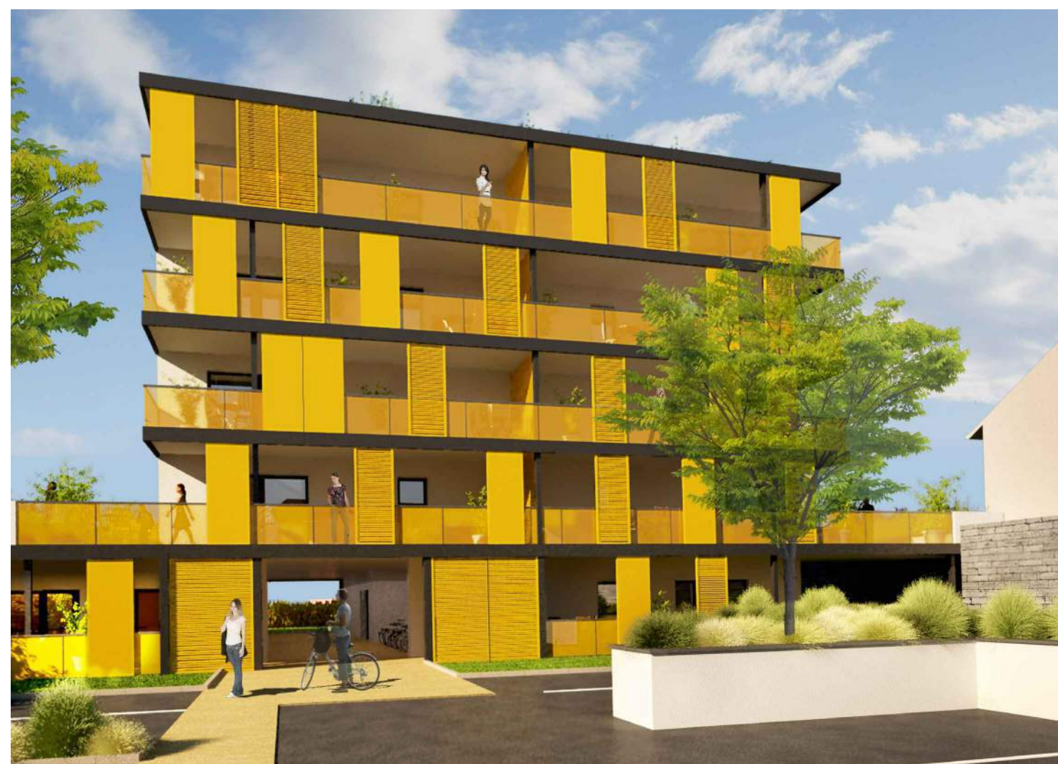
Adresse postale au Siège Social "SNC L'HORLOGERIE" - 380 Grande rue - BP29 - 01 570 FEILLENS - Tel: 03 85 36 13 13

Tel: 04 50 40 56 31 Email: lhorlogerie@orange.fr Site: www.lhorlogerie.com Bureau de vente sur place